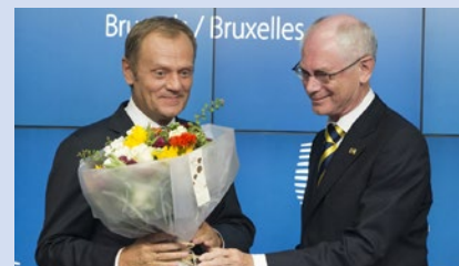
Novi i stari predsjednik Vijeća, Tusk i Van Rompuy

Sama činjenica da je Poljak na mjestu predsjednika Europskog vijeća jaka je poruka Moskvi, bez obzira na to što će Donald Tusk primiriti svoje antiruske stavove. No, kao niti Jean-Claude Juncker, niti Tusk nije krpena lutka, nego dugogodišnji premijer jake osobnosti. Politika iz Bruxellesa bit će, prema tome, kontrastnija, obojenija, glasnjija, komunikativnija, iako možda nekad i kontradiktornija nego ranije (str. 3).